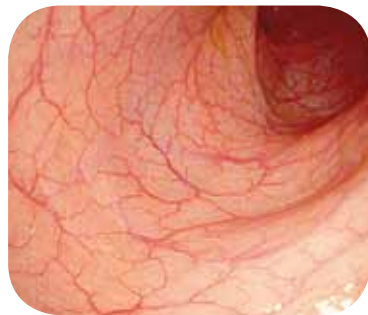
Изображение высокого разрешения (HD+)