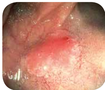
С улучшением оттенка изображения