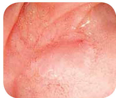
Без улучшения оттенка изображения