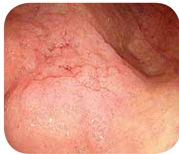
С улучшением изображения структуры слизистой