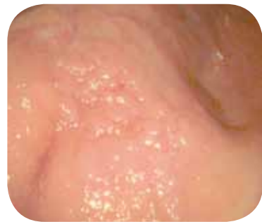
Без улучшения изображения структуры слизистой